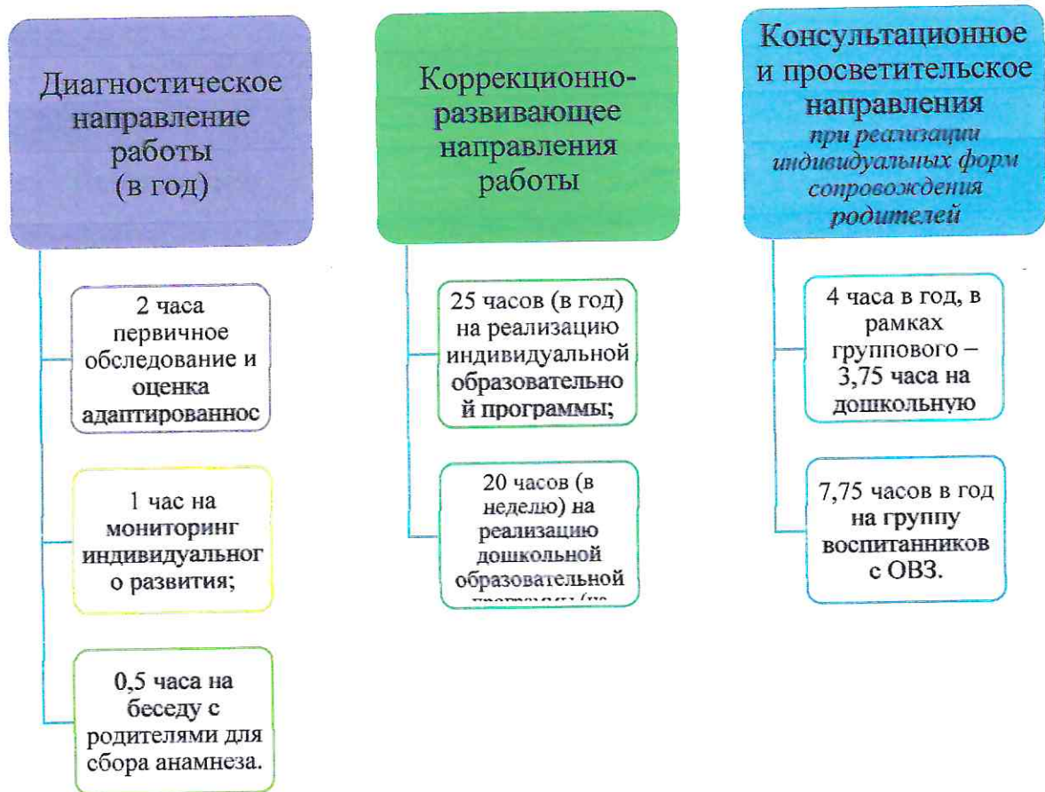
График организации образовательного процесса